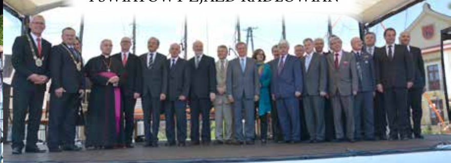
I ŚWIATOWY ZJAZD RADŁOWIAN