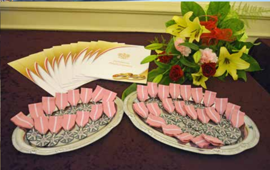
Jubileusz Złoty Godów