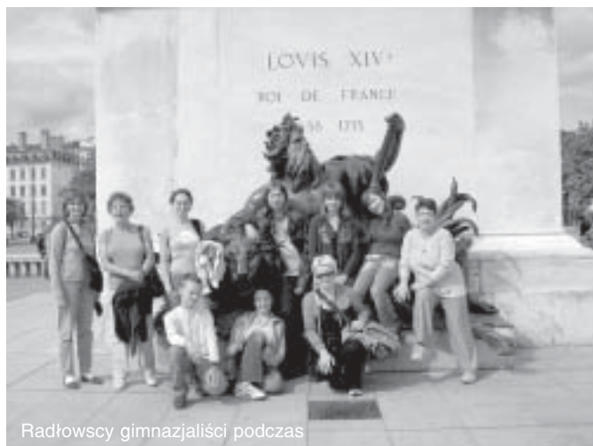
Radłowski gimnazjaliści podczas

Ważnym aspektem wizyty była wymiana doświadczeń na gruncie organizacji systemu nauczania w szkołach oraz dydaktyki. Nauczyciele i uczniowie z Francji obserwowali lekcję języka angielskiego, brali udział w specjalnie przygotowanych na tę okazję zajęciach konwersacyjnych, mających na celu ukazanie różnic i podobieństw kulturowych oraz stylów życia w obu krajach. Odbyła się także dyskusja na temat dalszej współpracy w ramach projektu Socrates-Comenius. Ponowne spotkanie przedstawicieli obu szkół było odpowiedzią na zaproszenie Francuzów. Rewizyta grupy uczniów i nauczycieli z naszej szkoły w Le Teil odbyła się w dniach 23-29 września 2006 r. Podczas kilkudniowego pobytu młodzież zwiedziła: Lyon, Nimes, Le Teil, Montelimar oraz jaskinię Auen d'Orgnac. Niezapomniane wrażenia wywarła wycieczka nad Morze Śródziemne w okolice naturalnego rezerwatu przyrody w regionie Camargue, gdzie można było podziwiać unikalne gatunki roślin i zwierząt. Uczniowie i nauczyciele zwiedzali starożytne miasto Nimes, w którym do dzisiaj zachowały się budowle z tego okresu w bardzo dobrym stanie. Aktywne uczestnictwo w życiu szkoły francuskiej poprzez udział w lekcjach i zajęciach pozalekcyjnych, sprzyjały integracji i poznaniu obu kultur.