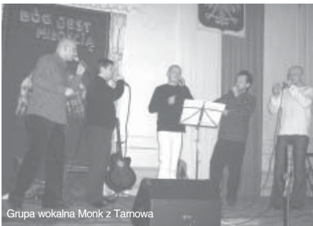
Grupa wokalna Monk z Tarnowa

Koncerty Grupy Pod Gruszą cieszą się w naszym środowisku sporym zainteresowaniem i uznaniem. Programy słowno - muzyczne o Karolinie Kózkównie, o Janie Pawle II, a także inne, zawsze gromadziły liczną grupę słuchaczy spragnionych estetycznych wrażeń. Największym powodzeniem cieszą się organizowane od kilku lat, koncerty kolęd i pastorałek.