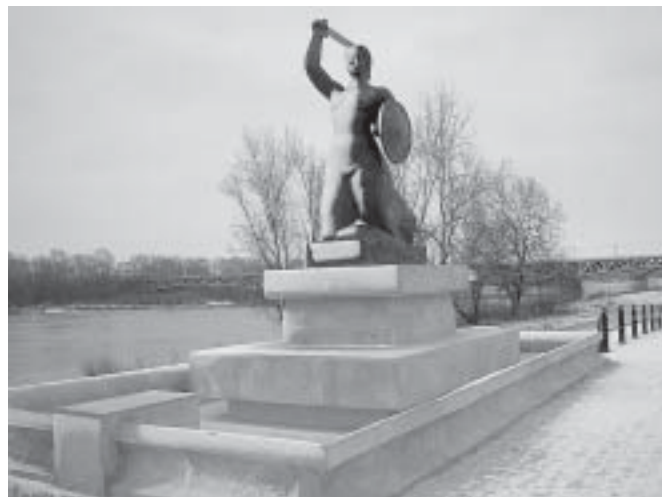
“Syrena w zimowej szacie”, fot. Zb. Marcinkowski, styczeń 2007 r.