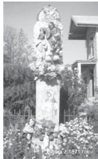
Figura z 1871 roku