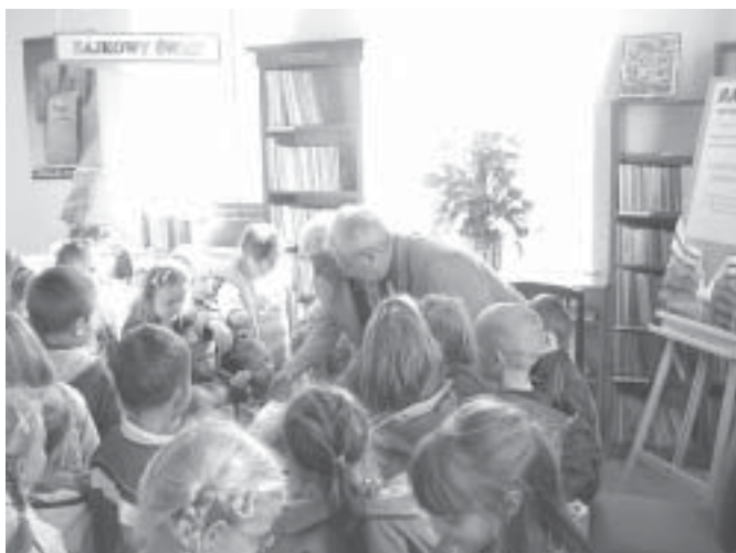
Na koniec spotkania Wójt przygotował dla dzieci słodką niespodziankę